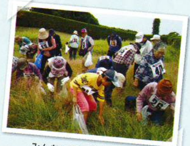
みんなで楽しくくり拾い