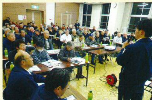
下関市防災安全課の説明