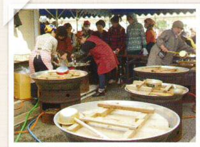
行列のできるうどんバザーの大釜