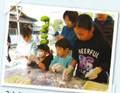
みんなでおいしくいただきます