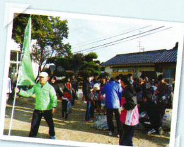
さあ出発 クリーン大作戦

12月3日(日)午前8時30分から、ふれあいクリーン大作戦が行われました。各地点からスタートし、ごみを拾いながら、ゴール地点の生野小学校・山の田小学校・大学町3丁公園に到着し、集めたゴミを分別した後、ふれあい行事を行いました。