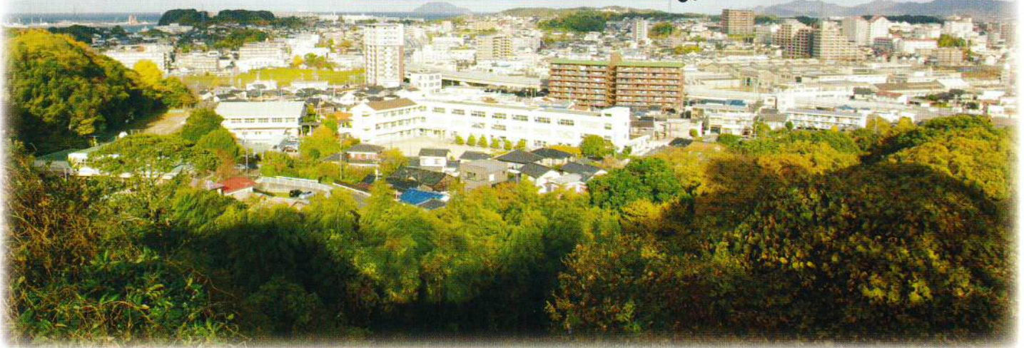
戦場ヶ原から生野小学校を望む