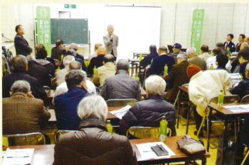
北部公民館での防災講習会