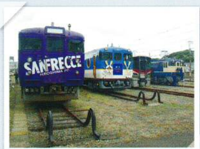
なつかしい列車展示