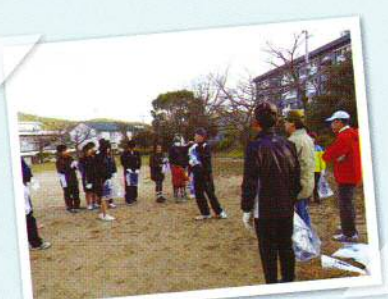
まちをきれいにしてきたよ