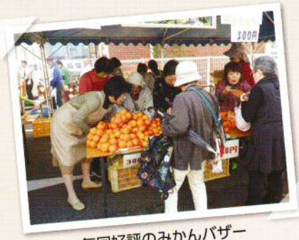
毎回好評のみかんバザー