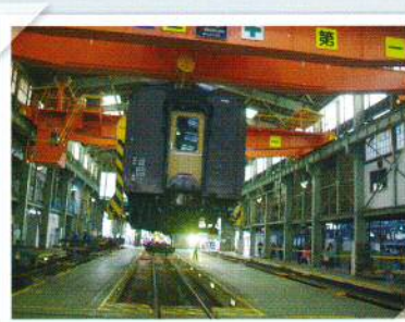
大型クレーンで吊上げ移動