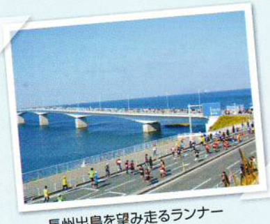
長州出島を望み走るランナー