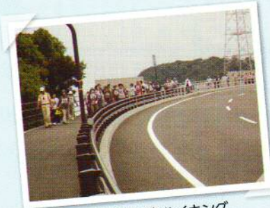
美しい海岸沿いをハイキング

快晴の日曜日、9時45分から山の田地区スポーツ推進協議会主催の「ふれあいハイキング」が、北部公民館から響灘を望む長州出島を右に見ながら、美しい海岸沿いのコースを金比羅公園まで歩きました。公園ではグラウンドゴルフやくり拾いのイベントがあり、秋の1日をふれあいと体力作りで楽しみました。