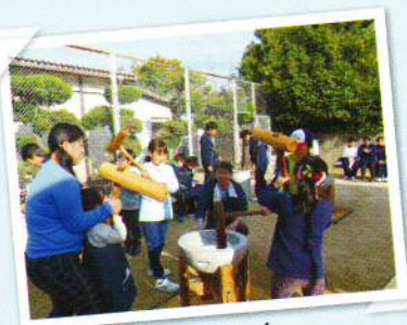
楽しくもちをつく

大学町地区社会福祉協議会恒例の「ふれあもちつき大会」が、大学町3丁公園内の大学町集会所で開催されました。よく晴れた青空のもと、バーナー3台で蒸し上げたもち米を臼2台でもちに仕上げ、小学生・中学生・町民でする共同作業は「楽しいなあ」と言いながら好みのもちを沢山食べました。