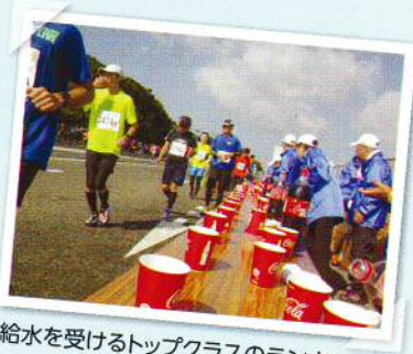
給水を受けるトップクラスのランナー

11月5日(日)下関海響マラソンが開催されました。マラソン日和のもと、国道191号線北バイパスの響灘を望む美しい景色の沿道で、快走する参加者に武久地区自治連合会の約60名のボランティアが給水やみかんでおもてなし。大会を大いに盛り上げました。