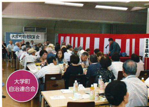
大学町自治連合会