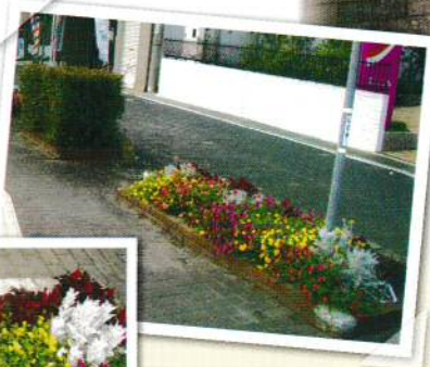
西中国信用金庫前③ (藤川ビル)