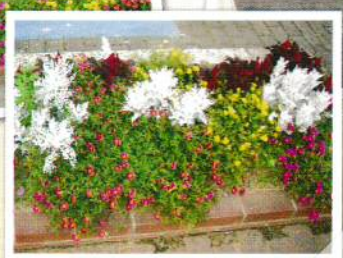
西中国信用金庫前②