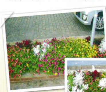
西中国信用金庫前①