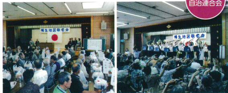
幡生地区自治連合会