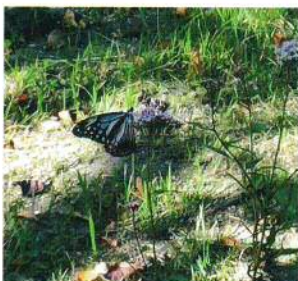
【10月8日】山の田6号公園