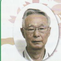
山の田地区 まちづくり協議会 会長