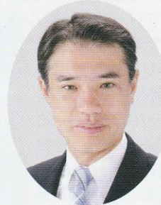
香川 昌則 市議会議員